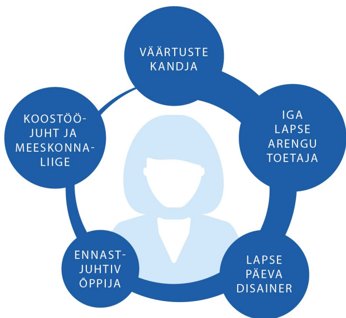
Joonis 2. Lasteaiaõpetaja põhikompetentsid kompetentsimudelis

Kompetentsimudel on jagatud rollideks – kirjeldatud on lasteaiaõpetaja viit olulist rolli, millest igaüks eeldab vastavat rollikäitumist ja kompetentse.